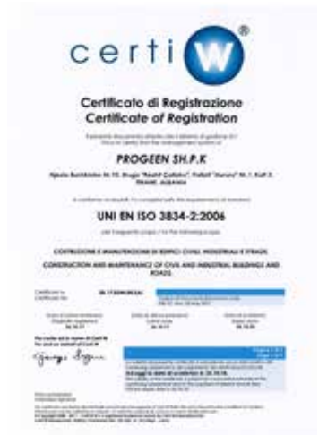
UNI EN ISO 3834-2:2006